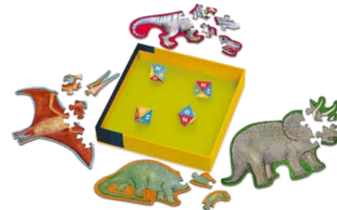
Авторы игры: Грегори Киршбаум и Алекс Сандерс

Конец игры: Игрок, которому первым удастся полностью собрать свой пазл, объявляется победителем.