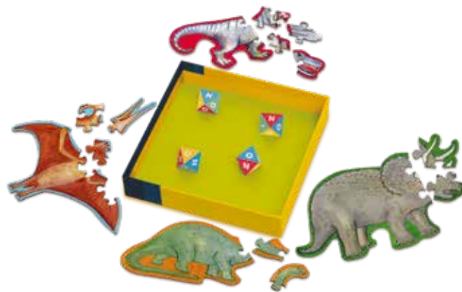
Un jeu de Grégory Kirszbaum & Alex Sanders

Contents: 1 dice tray, 4 dice with 8 sides, and 4 dinosaur puzzles with 12 pieces (a diplodocus, a pterosaur, a tyrannosaurus and a triceratops).