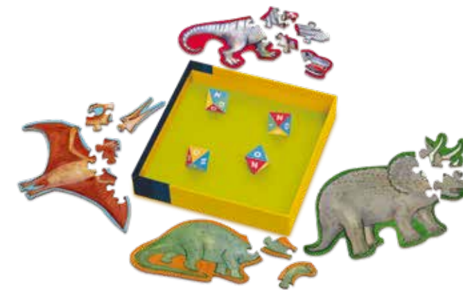
A game by Grégory Kirszbaum & Alex Sanders

End of the game: As soon as a player succeeds in completing their puzzle, they are declared the winner of the game.